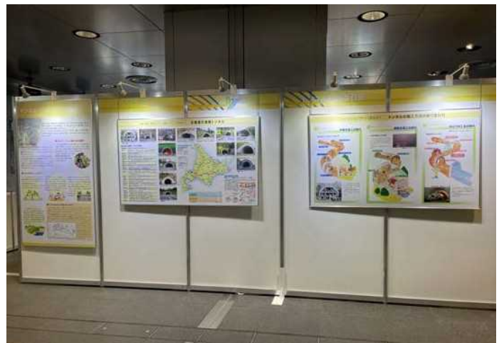
トンネル研究委員会