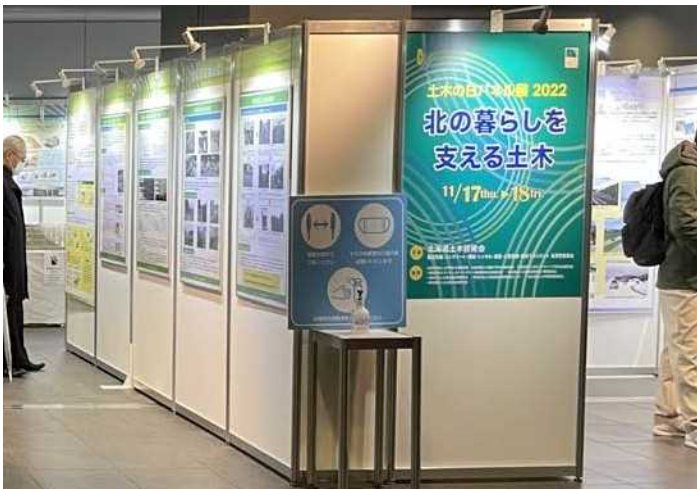
開催看板・マスク着用看板・アルコール配置