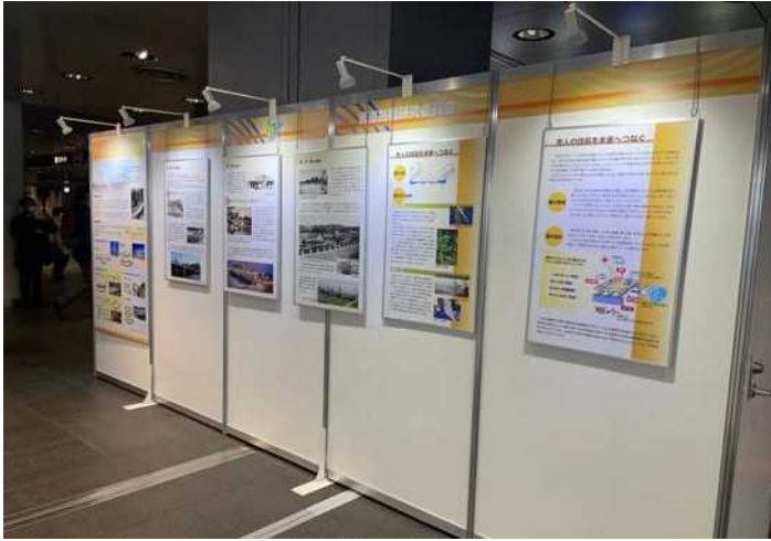
鋼道路橋研究委員会