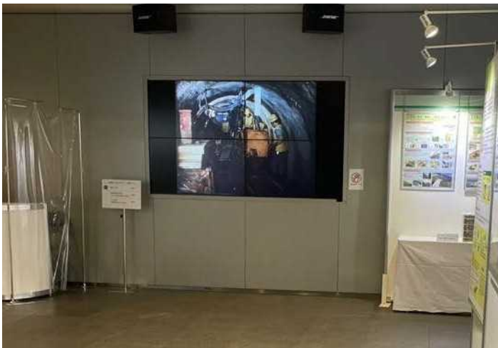
映像(イブニングシアター)