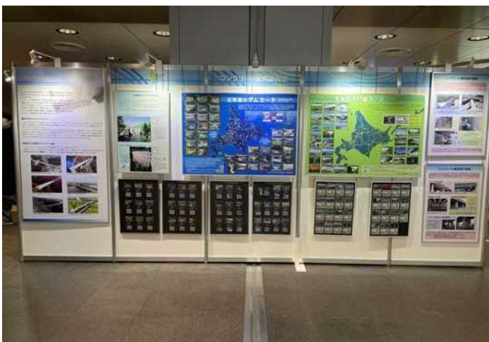
コンクリート研究委員会