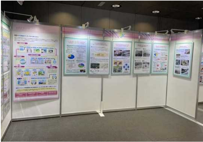
建設マネジメント研究委員会