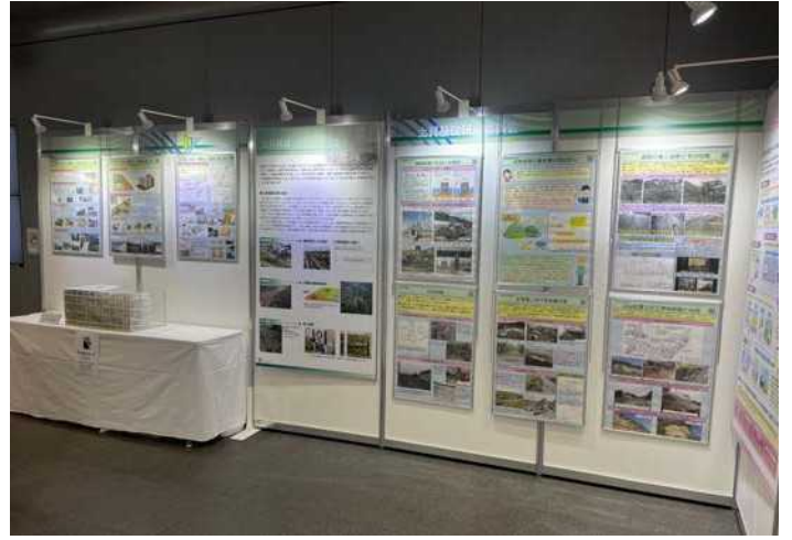
土質基礎研究委員会